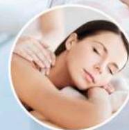
SANASPORT BEAUTY ■■■■■