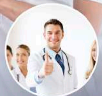
SANASPORT SERVICE ■■■■■