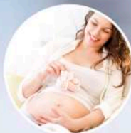
SANASPORT BABY&MUM ■■■■■