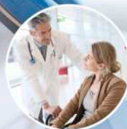
SANASPORT SANALEX ■■■■■