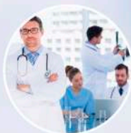
SANASPORT CLÍNICA ■■■■■