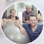
SANASPORT ESCUELA ■■■■■