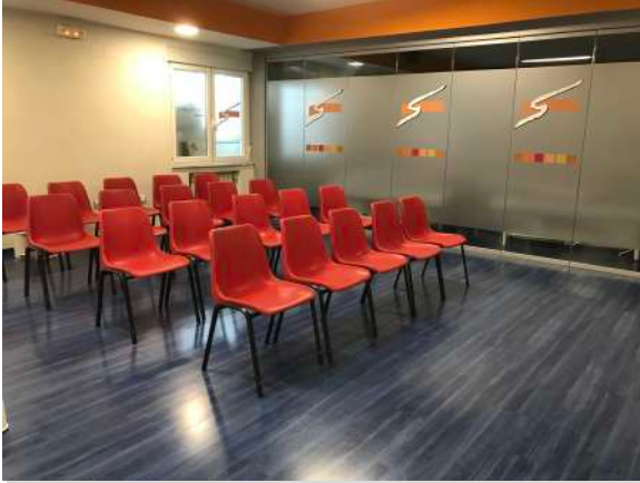
AULA DE TEORIA