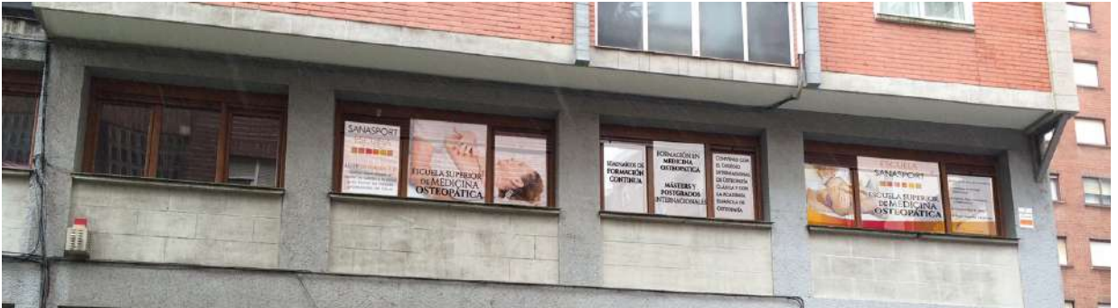
FACHADA PRINCIPAL DE LA SEDE DE BILBAO

SEDE DE CALLE LEHENDAKARI AGUIRRE 91 - BILBAO