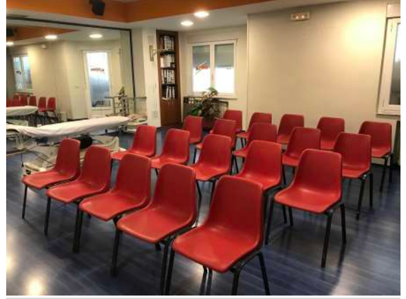
AULA DE TEORIA