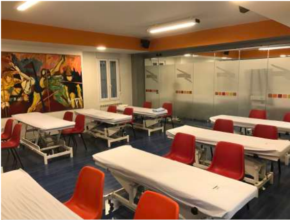
AULA DE PRÁCTICAS 1