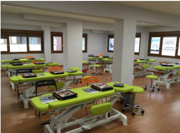
AULA DE PRÁCTICAS Nº 1