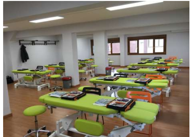
AULA DE PRÁCTICAS Nº 2