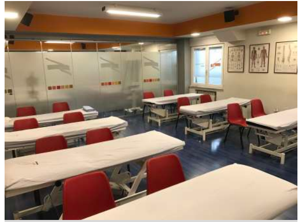
AULA DE PRÁCTICAS 1