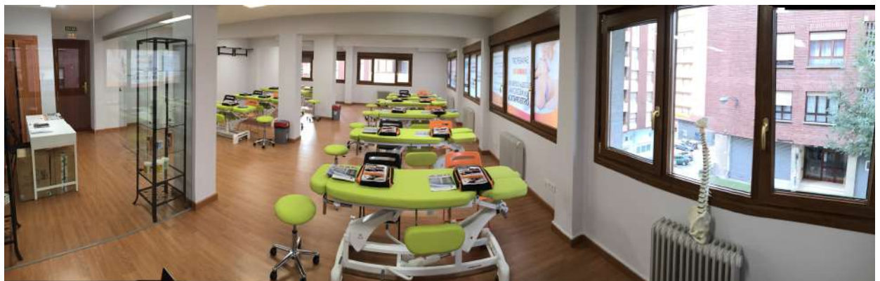
AULA DE PRÁCTICAS Nº 1 - PRINCIPAL