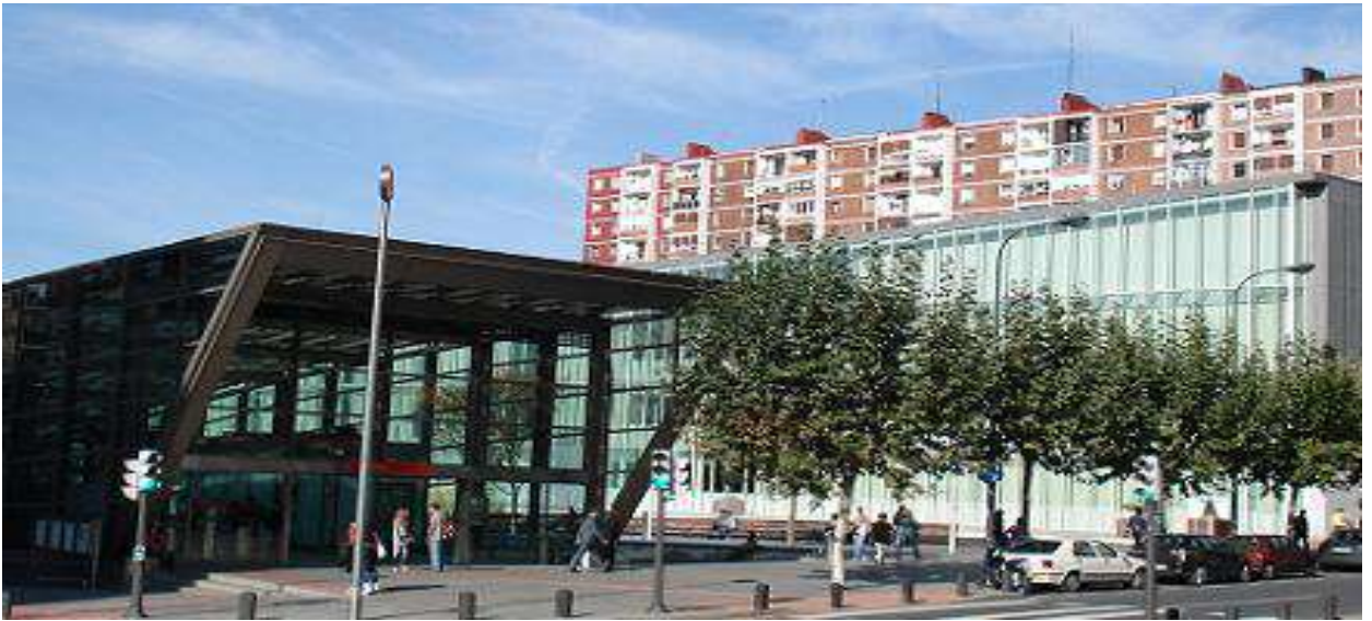
Parada de metro de Sarriko y conservatorio de música

Justo enfrente de la Escuela está la parada de metro de Sarriko.